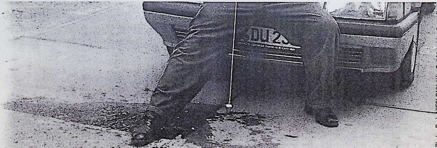
Photo : Boris NIESLONY, Was Soll Man denn Sonst Tun (What else should one do?)