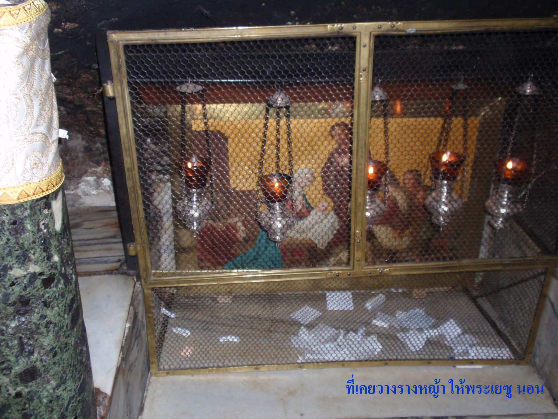
ที่เคยวางรางหญา ให้พระเยซู นอน