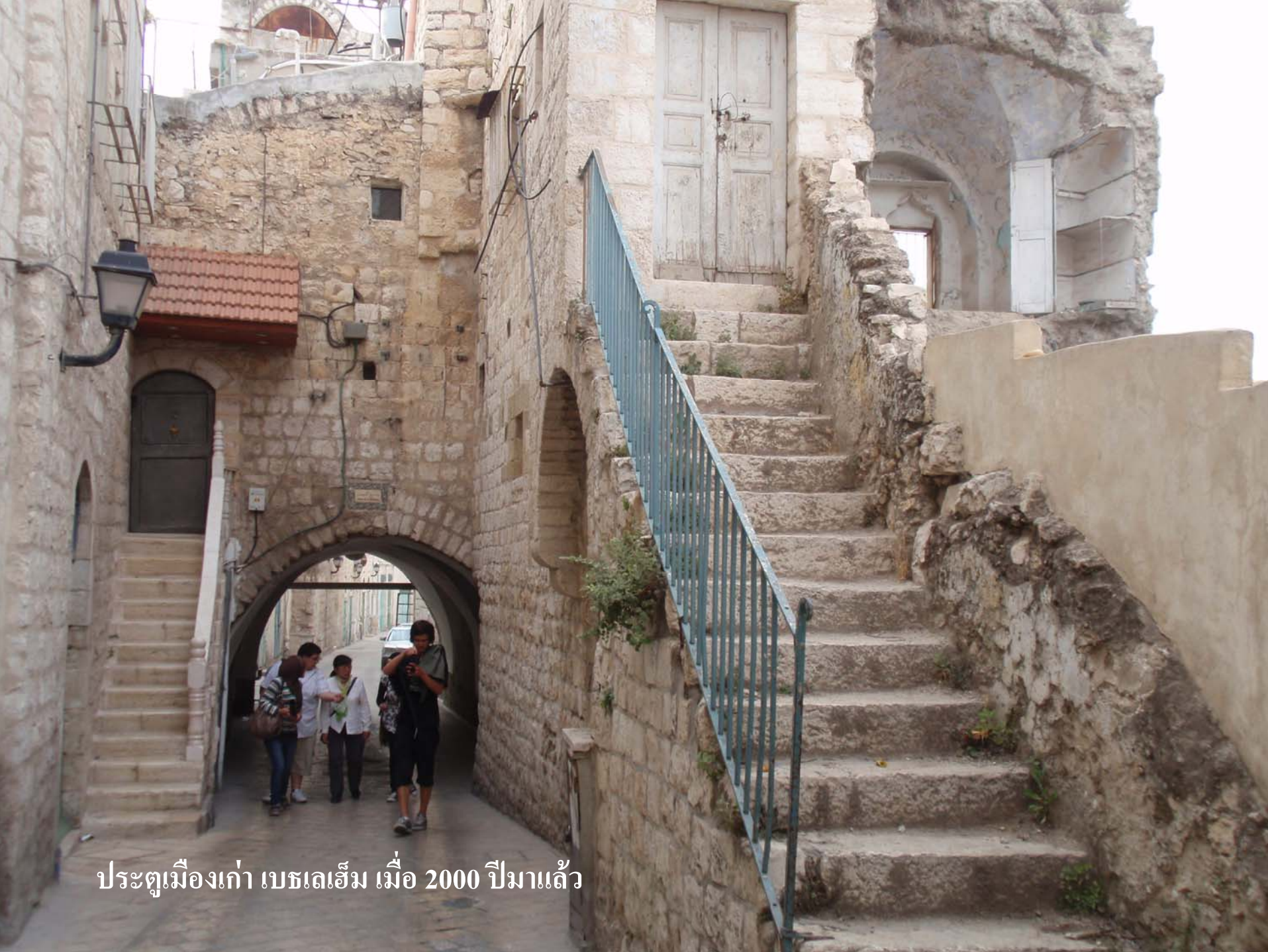
ประตูเมืองเก่า เบธเลเฮม เมื่อ 2000 ปีมาแล้ว