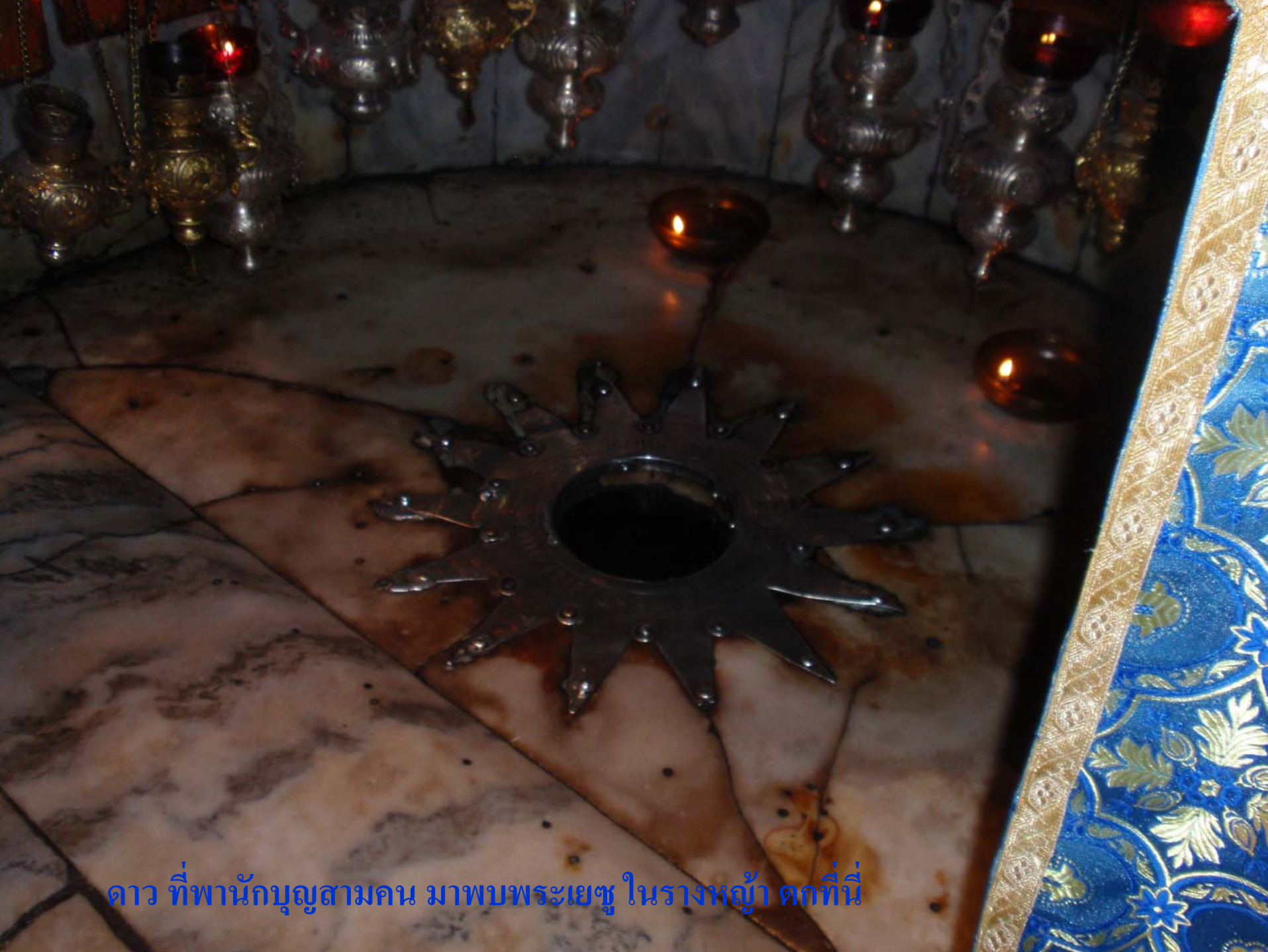
ดาว ที่พำนักบุญตามคน มาพบพระเยซู ในรางหญ้า ตกที่นี่