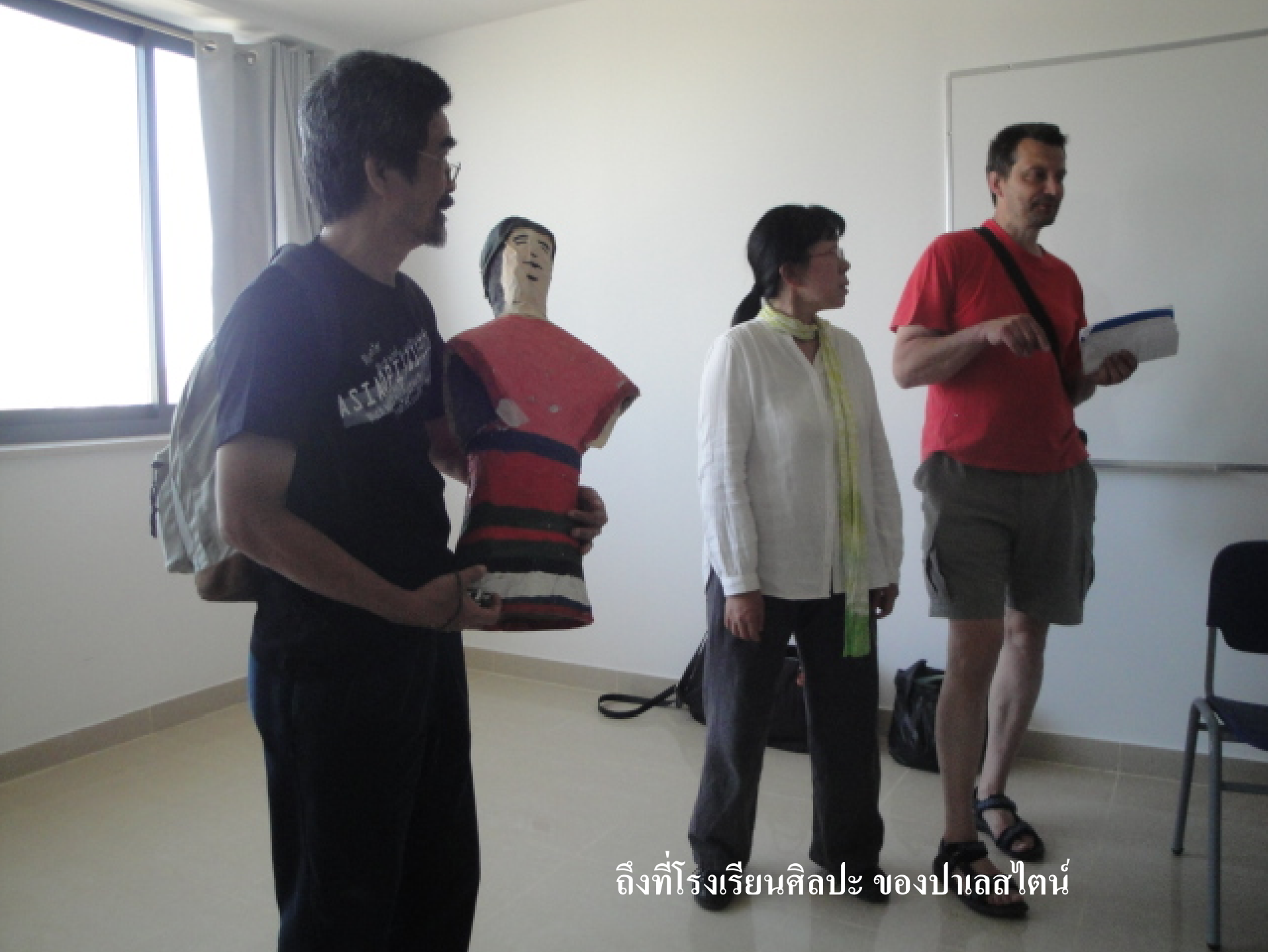
ถึงที่โรงเรียนศิลปะ ของปาเลสไตน์