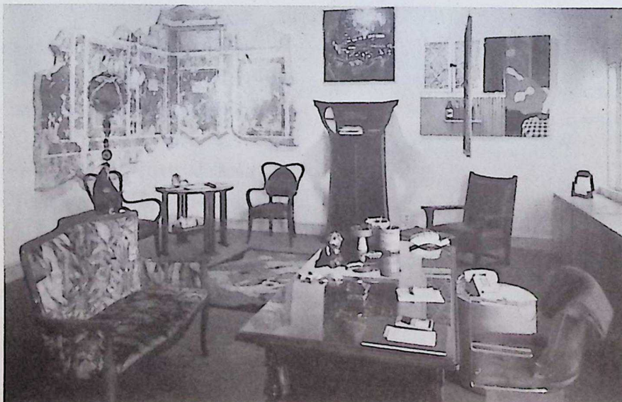
ยกผนังมาทังอัน เสริมด้วยความใหม่ของจิตรกรรมโมเดิร์นอาร์ตและวัตถุโบราณ