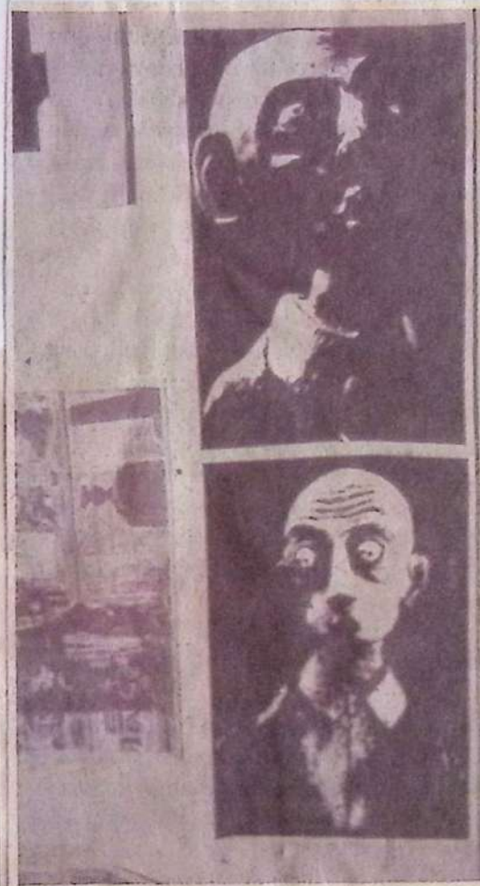
ส่วนหนึ่งของมโกลสีป

ผลงาน สหชาติ จันทิมาธร แฟกซ์มาร่วมงานแฟกซ์ศิลปินาวาชาติ