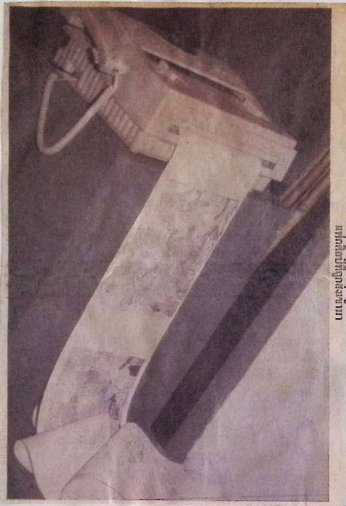
บทกวีศิลปะที่ถูกตั้งคำถาม