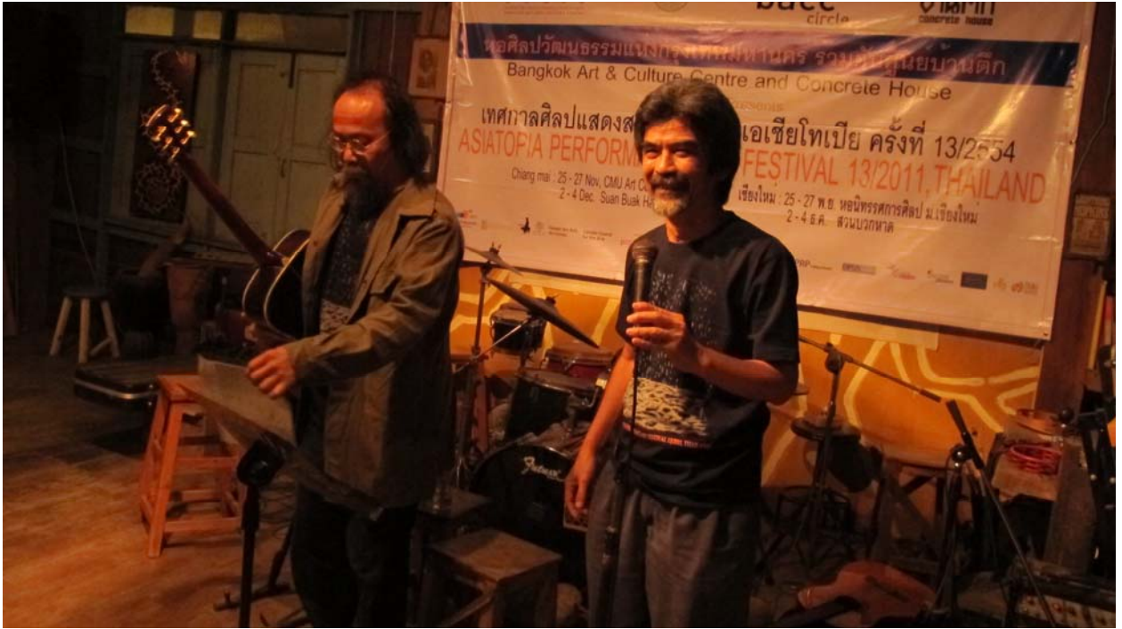
สองภณทาร์กซ์เอเชียโทเปีย 13 ร่วมกันต้อนรับศิลปิน ในวันเสียงรับรองที่ร้านอาหารสุดแสน เชียงใหม่ 24 พย 2554

เนื่องจากงานเอเชียโทเปียเชียงใหม่ ได้มีการเตรียมการเอาไว้ ในต้นเดือนธันวาคม โดยได้รับความร่วมมือจากเครือข่ายด้านวัฒนธรรมเชียงใหม่ และเทศบาลนครเชียงใหม่ เอาไว้ล่วงหน้าแล้ว การที่จะยุบหรือย้ายเวลามาจัด รวมกับเวลาที่กรุงเทพฯ จะย้ายมา ก็เป็นไปได้ แต่ครั้งจะให้ส่วนที่ย้ายมาจากกรุงเทพฯ มาจัดร่วมกับเชียงใหม่ ก็ไม่สมควรเพราะศิลปิน ไม่สามารถเดินทางออกนอกไปได้ เราคิดว่า จะให้เป็นการผนวกรวมเข้ากับชั่วโมงเรียนของคณะวิจิตรศิลป์ ม.ช ก็เป็นไปได้ เอเชียโทเปีย ภาค กทม. จึงต้องจัดในพื้นที่ใหม่ คือ หอศิลปมหาวิทยาลัยเชียงใหม่ และอาศัยห้องเรียนคณะมีเดียอาร์ตและการออกแบบ เป็นที่จัดกิจกรรม เวอร์คช็อป