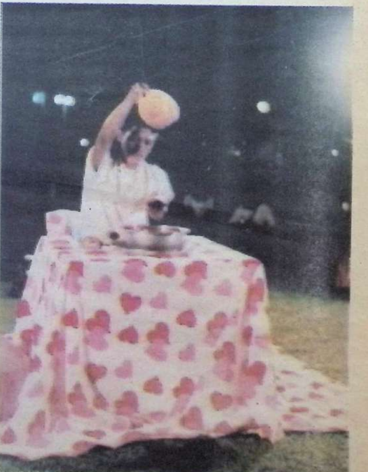
วิซุเจอร์ ดั่งใหญ่บลูย์ ลงทุนให้คนร่วมตัดผมทั้งและโกนคิ้วทั้งสอง พร้อมกับเพลงซึ้งๆช้าและซึ้งหวาน กล่าวลาวเรื่องราวเก่า...ที่จดคิดที่หวานขึ้นไว้เบื้องหลัง